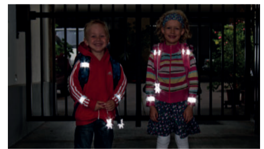
Sicherheit durch Sichtbarkeit!

Sorgen Sie dafür, dass Ihr Kind im Straßenverkehr rechtzeitig gesehen wird! Gerade im Herbst und Winter, wenn es in der Früh noch dunkel ist oder bei nebligem Wetter ist helle Kleidung von Vorteil. Noch besser wirken Reflektoren an Kleidung und Schultaschen – mit diesen können Kinder von Fahrzeuglenkerinnen und Fahrzeuglenkern schon aus einer Entfernung von 130 Metern wahrgenommen werden.