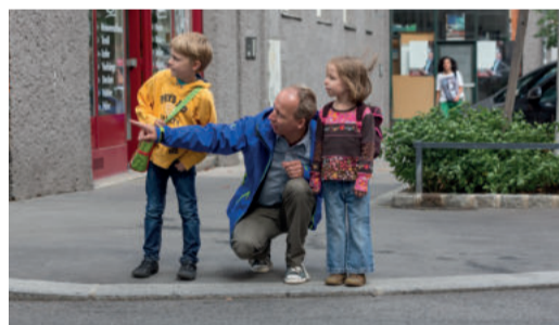
Regelmäßiges, gemeinsames Training ist wichtig!

Gehen Sie mit Ihrem Kind den Schulweg ab und erklären Sie ihm, warum es wo gefährlich ist und worauf es als Fußgängerin bzw. Fußgänger achten muss. Üben Sie problematische Stellen (siehe Schulwegplan) besonders gut! Beim nächsten Mal lassen Sie sich bereits von Ihrem Kind führen, das dabei über sein Verhalten spricht. So können Sie feststellen, ob es alles richtig verstanden hat und eventuell korrigierend eingreifen.